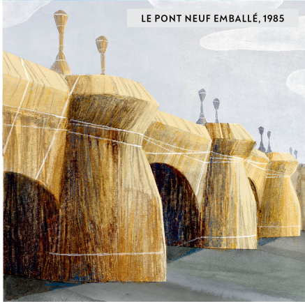
LE PONT NEUF EMBALLÉ, 1985

Tout cela était monumental. Et quand les gens n'avaient que deux semaines pour en profiter, c'était encore plus singulier. Est-ce que c'était vraiment arrivé, ou n'était-ce qu'un rêve ? Leurs œuvres devenaient des mythes, des légendes urbaines. « Te souviens-tu quand... ? », disaient les gens. « Oh, j'étais là ! Je l'ai vu ! », répondaient les autres.